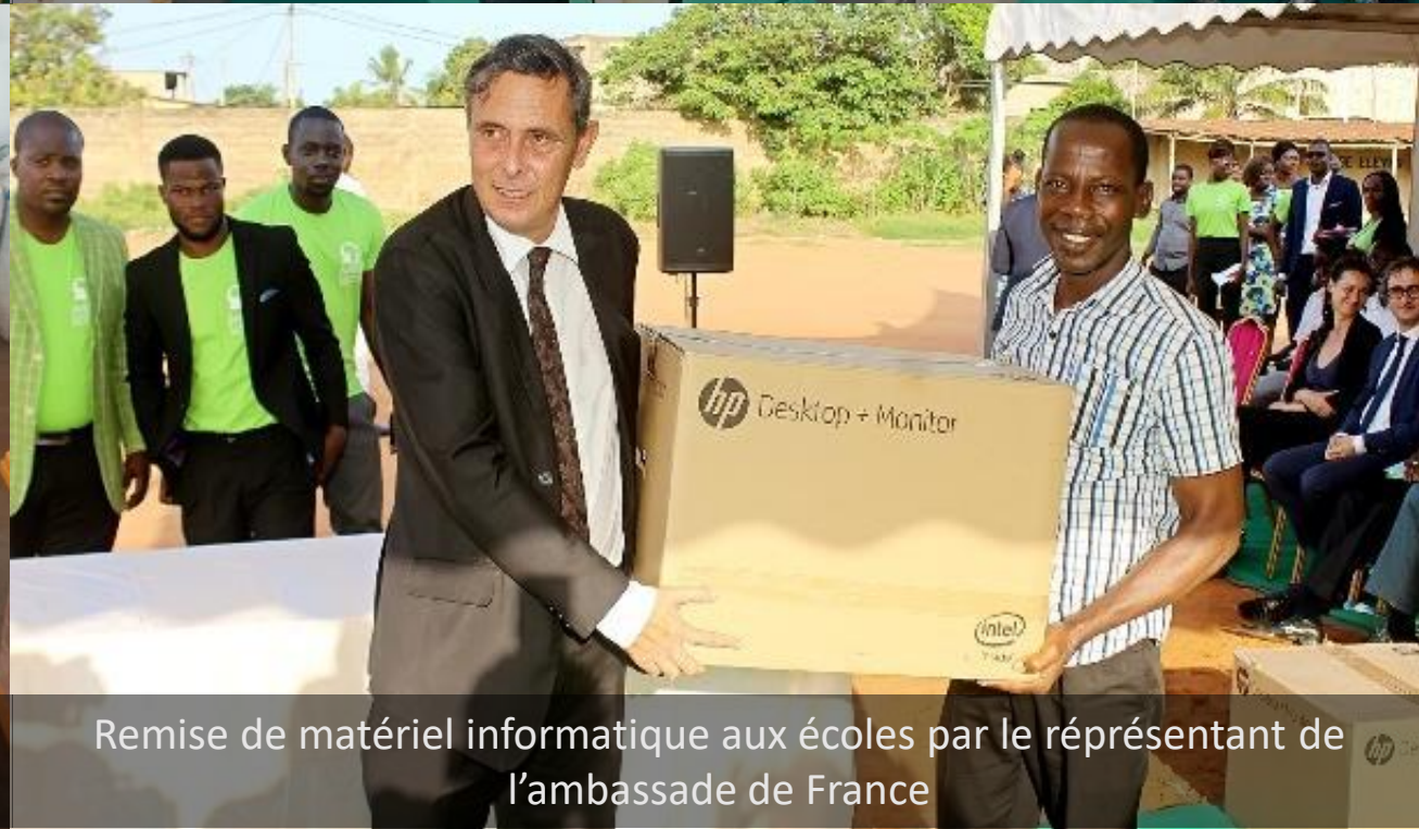
Remise de matériel informatique aux écoles par le représentant de l'ambassade de France