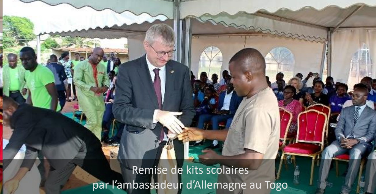
Remise de kits scolaires par l'ambassadeur d'Allemagne au Togo