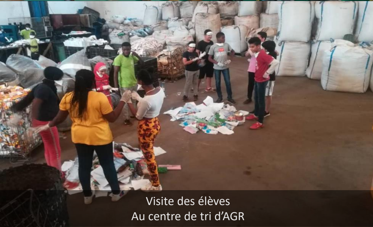
Visite des élèves Au centre de tri d'AGR