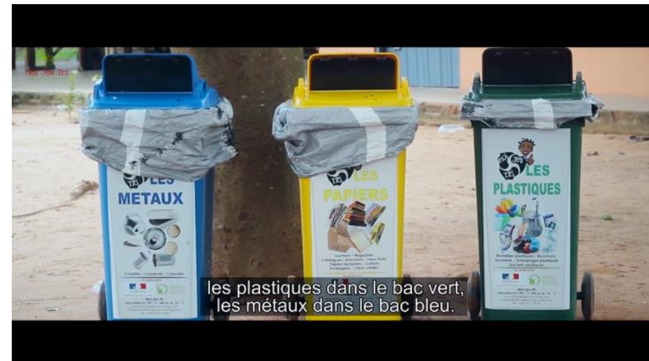
Vidéo de sensibilisation présentant les principes le programme socio-éducatif « Moi jeu Tri » Lire la vidéo...