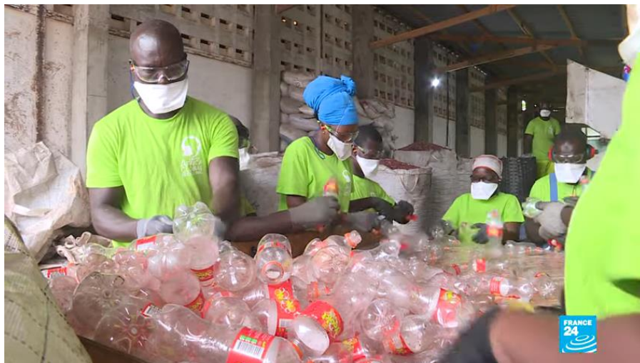
Reportage de la chaîne de télévision France 24 sur les activités du groupe Africa Global Recycling et l'association Moi Jeu Tri. Lire la vidéo...