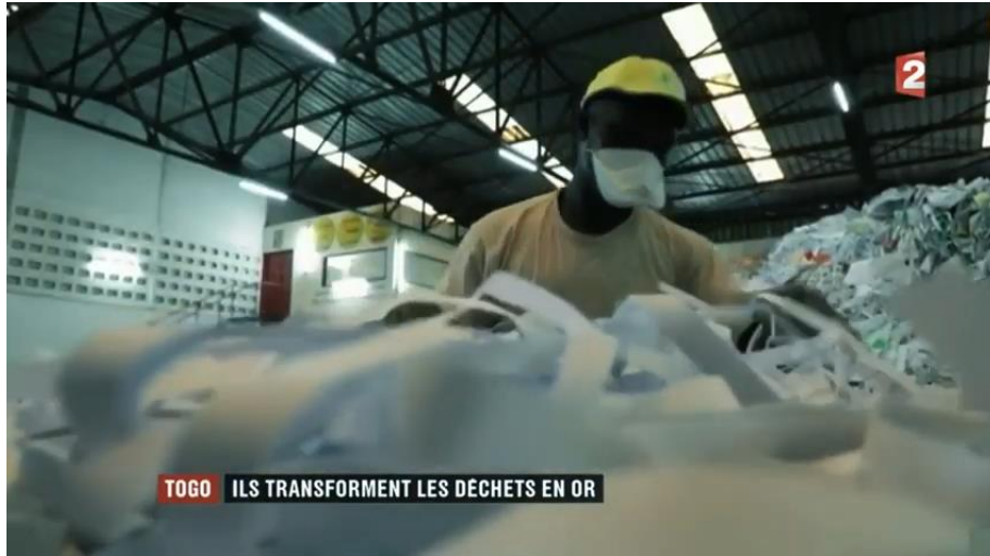
Reportage de la chaîne de télévision France 2 sur la valorisation des déchets par le groupe Africa Global Recycling. Lire la vidéo...