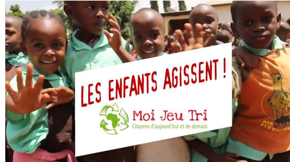
Vidéo bilan de l'année des activités Moi Jeu tri dans 40 écoles à Lomé Lire la vidéo...