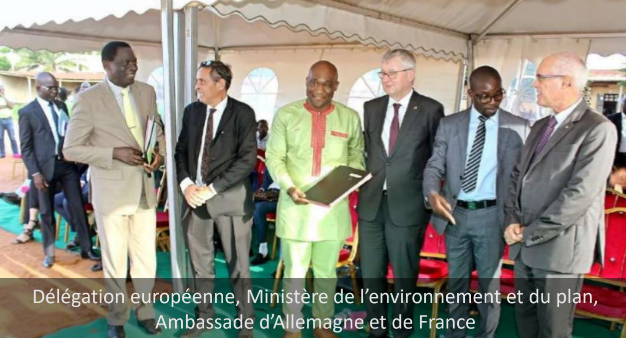
Délégation européenne, Ministère de l'environnement et du plan, Ambassade d'Allemagne et de France