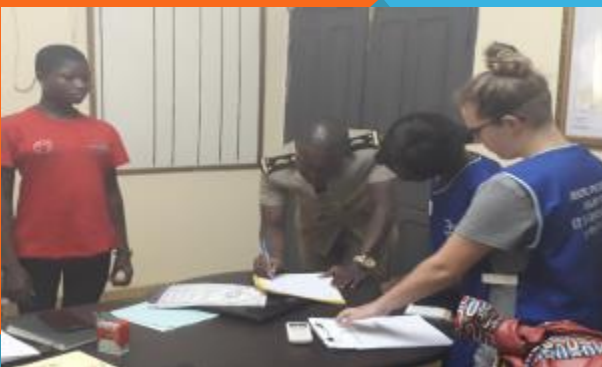
Réunification familiale dans la sous-préfecture d’Ndouci