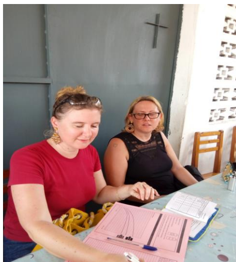
Bénévoles de l'AIFCI

Le Centre est logé provisoirement dans les locaux du Comité de Gestion du Village d'ANANI, 150 m à gauche après le rond-point de l'Autoroute.