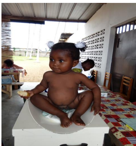
Bébés à la pesée