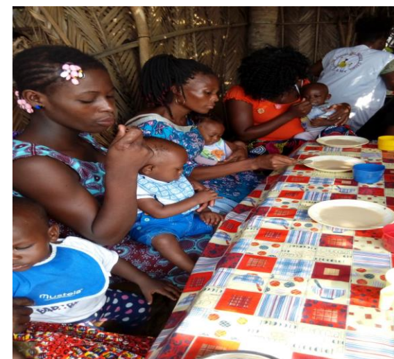
Dégustation de bouillie de soja (gratuite)

MISSION : La mission dévolue au CAMA est d'assurer à la population cible (Mère – Enfant) des activités de prévention, d'éducation et de sensibilisation.