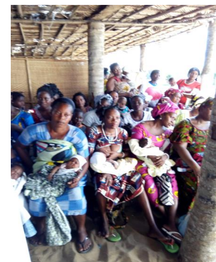
Vendredi au CAMA