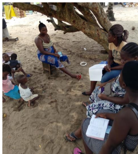
Visite à domicile